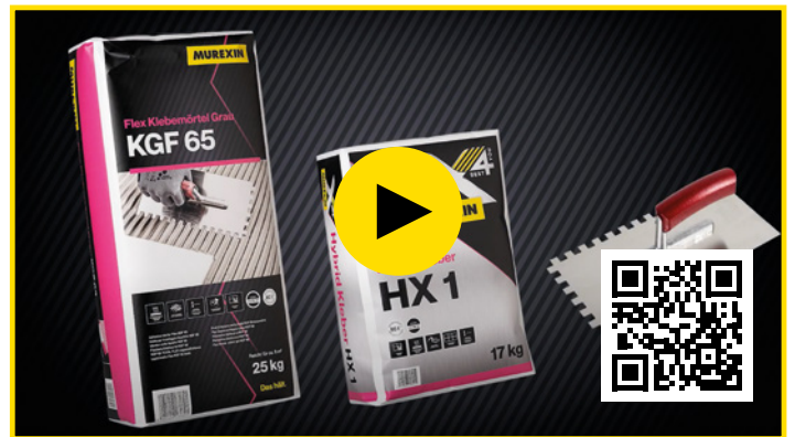
Hier gehts zum neuen Murexin Video „Wand verfliesen“!