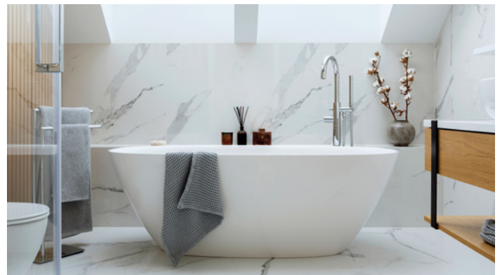
Ideal fürs Badezimmer - in vielen Farben erhältlich!