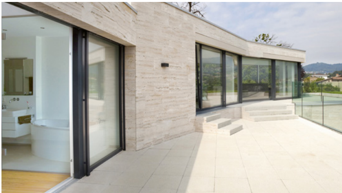
Ideal zur Verlegung von keramischen Belägen im Außenbereich