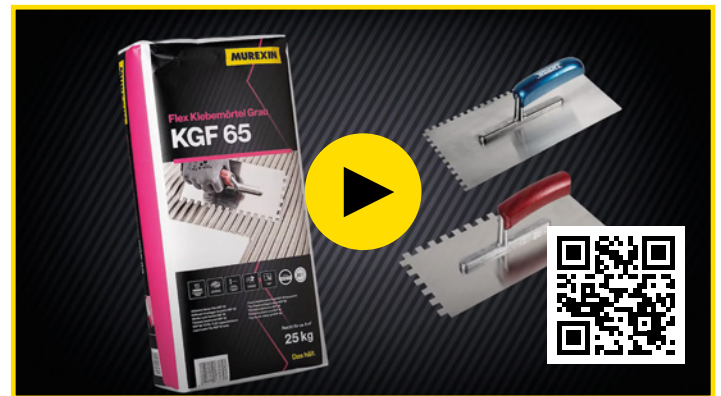
Hier gehts zum neuen Murexin Video „Boden verfliesen“!