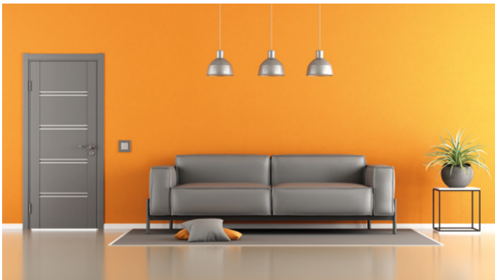
Fürs Beschichten nicht befahrbarer Oberflächen